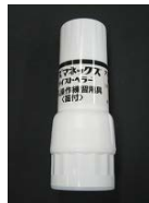
吸入操作練習用具