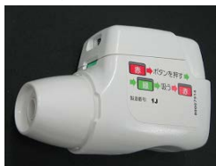
ジェヌエア練習器 (乳糖ありとなしそれぞれ)