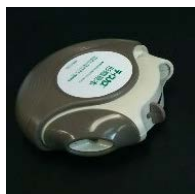
ディスクス練習器