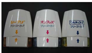
各種ブリーズヘラー